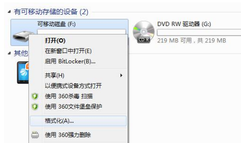
图 6. 格式化 U 盘

(3). 下载完成以后, 拔掉 USB 连接线, 重新连接电源, 即可进行播放。