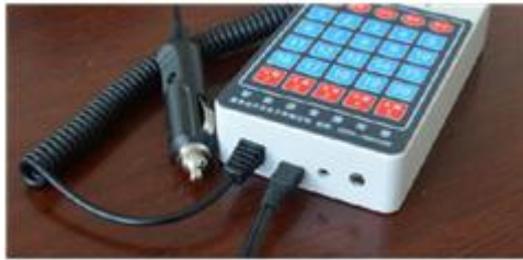
图 5. USB 接口连接 PC 机