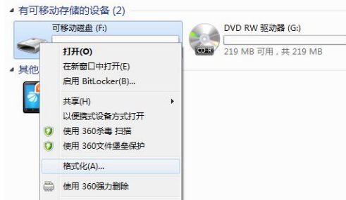
图 6. 格式化 U 盘