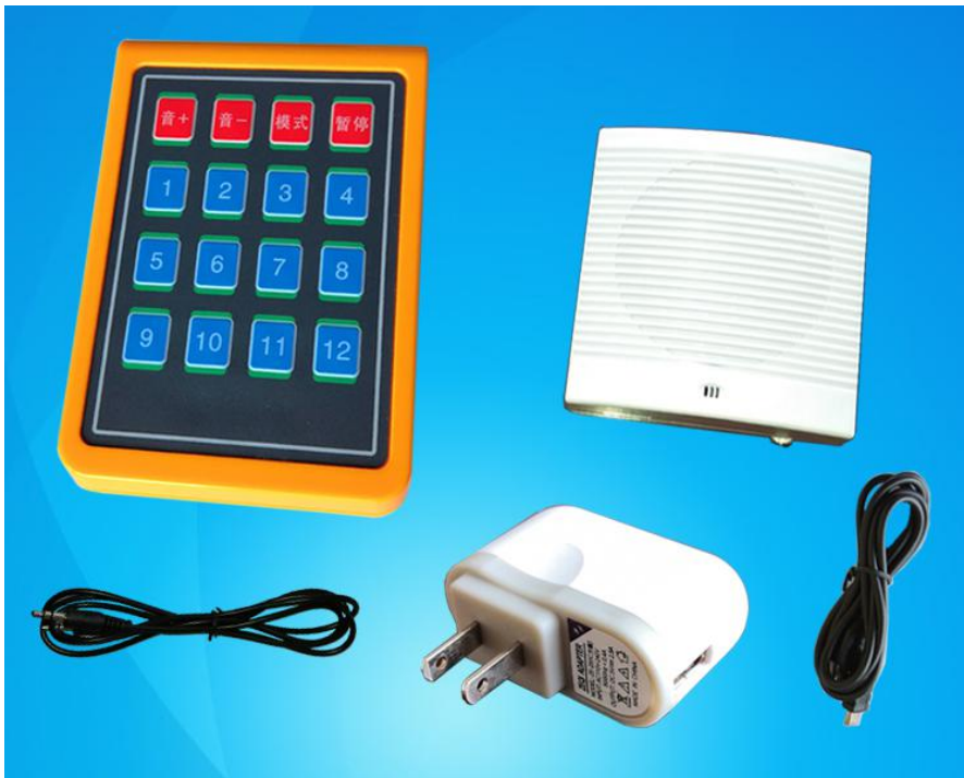
图 1. 播放器整体图