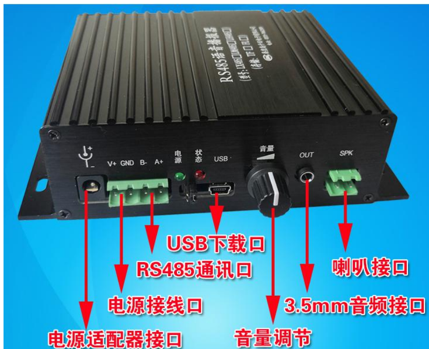
图 1 播放器整体图