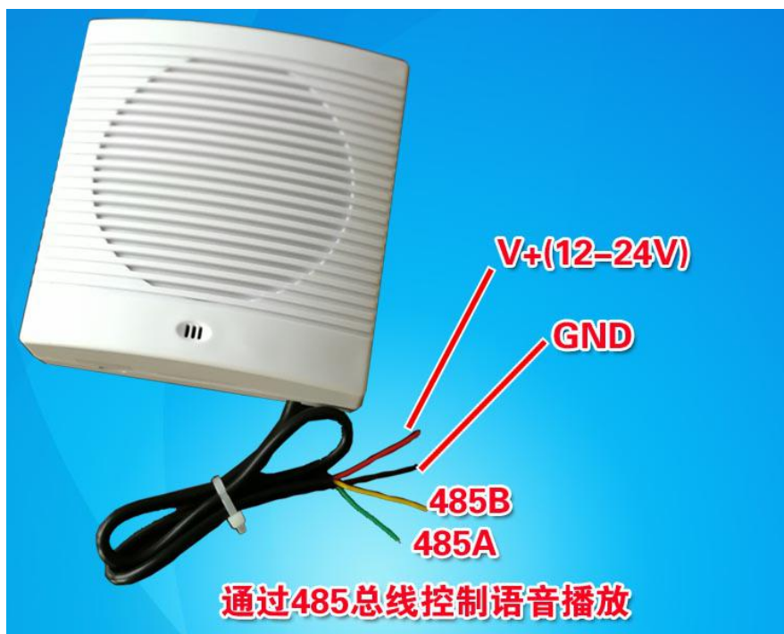
图 1 播放器整体图